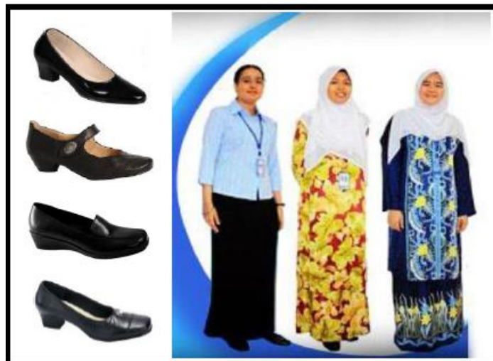
Gambar 2: Rupa diri, pakaian dan rambut graduan wanita (kasut bertumit bertutup)