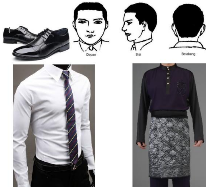
Gambar 1: Rupa diri, pakaian dan rambut graduan lelaki