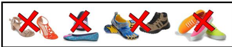
Gambar 3 : Jenis-jenis kasut yang tidak dibenarkan

7.3.2 Penggunaan kasut kulit berwarna hitam atau gelap amat digalakkan.